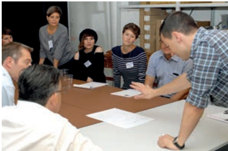
ENGAGIERTE DISKUSSIONEN RUND UM EIN SCHMUCKPORTAL.

Un portail commun de la bijouterie présente son lot de difficultés et notre workshop a confirmé cette première impression. Toutefois, chaque nouveau défi possède sa solution. S'il n'est jamais assuré qu'un projet novateur soit couronné de succès, il est néanmoins indubitable que les personnes qui ignorent les signes du temps et ne décèlent pas les problèmes ont déjà perdu la partie.