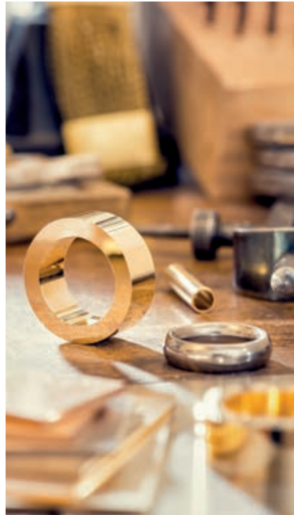
HALBZEUG AUS OEKOGOLD®.

Nous demeurons en tout temps à votre disposition pour vous donner des renseignements complémentaires sur le set informatif et les conditions de certification.