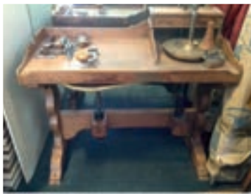
Table de travail à pierres précieuses en bois (1750-1800) à vendre

Table de travail à pierres précieuses en bois (1750-1800) en très bon état, superbe pièce.