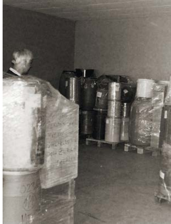
DIE ERSTE GEKRÄTZESAMMLUNG. LA PREMIÈRE RÉCOLTE DE LIMAILLE.

Découvrez la suite de cette étonnante histoire dans le prochain numéro de GYRNEWS.