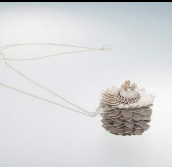
DAS SIEGERSTÜCK 2013 VON GERALDINE ROHRER.