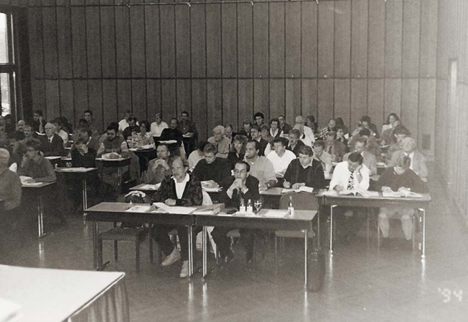
AM MEHRWERTSTEUER-SEMINAR 1994.