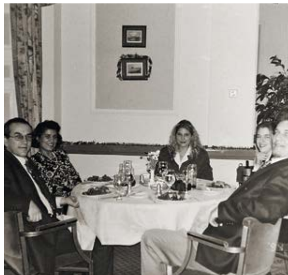
GEMÜTLICHE RUNDE BEIM ERSTEN WEIHNACHTSESSEN IN GUERNSEY.