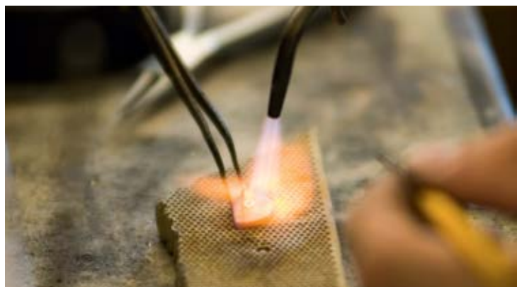
LERNENDE AN DER ARBEIT.