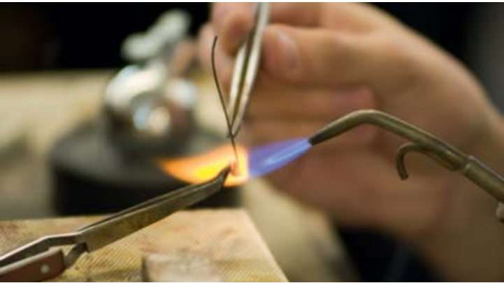
APPRENTIS AU TRAVAIL.