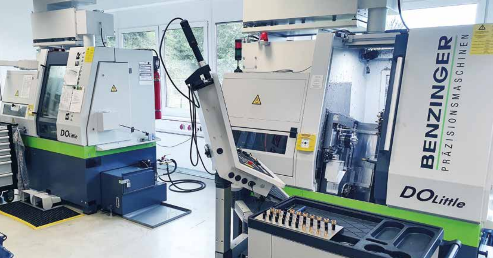
DER HAUSEIGENE MASCHINENPARK UMFASST ZWEI CNC-DREHMASCHINEN. | L'ÉQUIPEMENT INTERNE COMPREND DEUX MACHINES CNC.