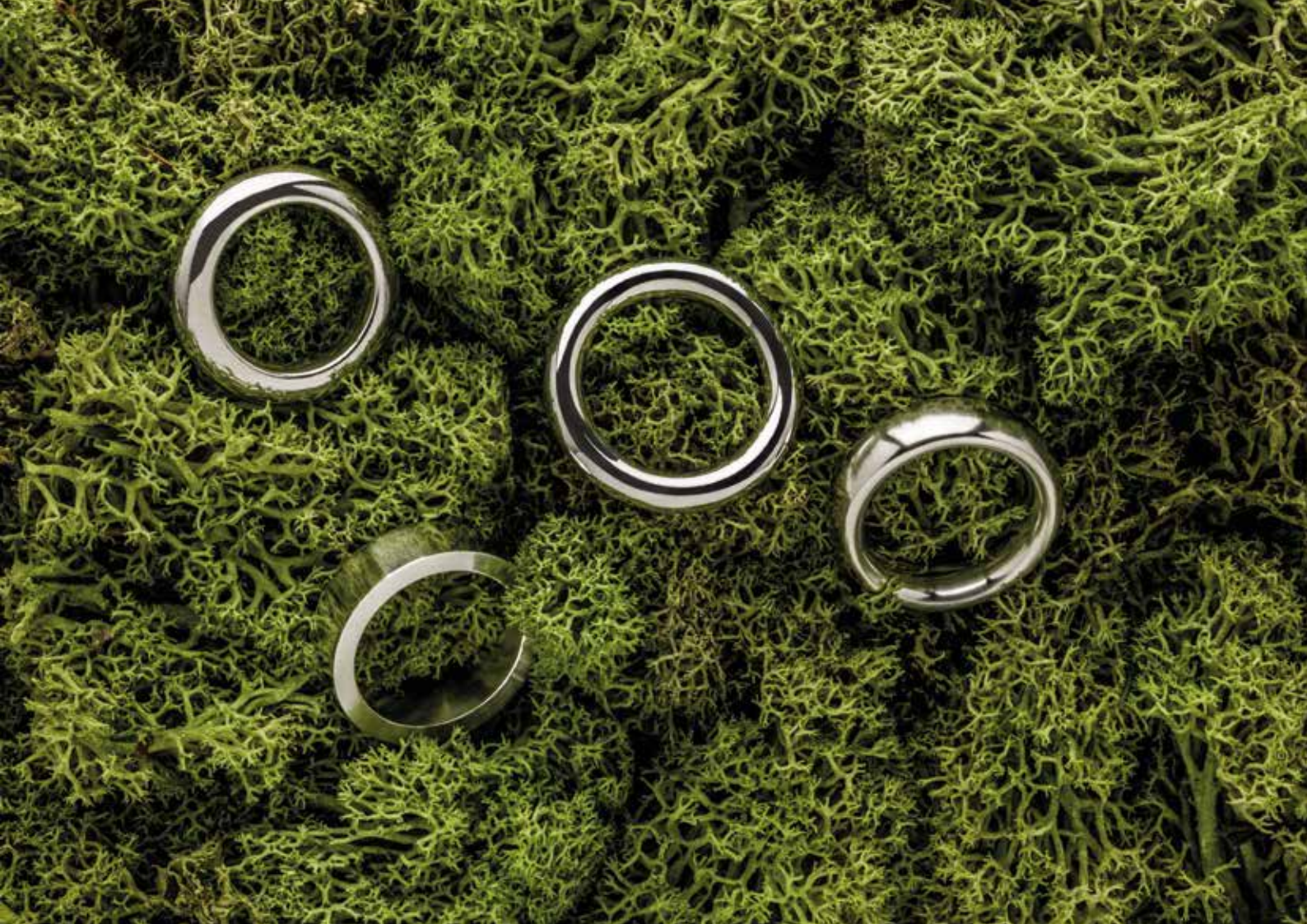
RINGROHLINGE IN UNTERSCHIEDLICHEN PROFILLEN. | DES ANNEAUX SEMI-FINIS EN DIFFÉRENTS PROFILES.

Eine halbautomatische Säge und eine Handdrehbank stehen für die Materialvorbereitung zur Verfügung. An zwei CNC-Drehmaschinen und vier Drehbänken werden die Ringe bearbeitet und für die Finish-Optionen werden Schüttelfässer, Poliermaschine, sowie diverse Werkzeuge für die Oberflächenbearbeitung verwendet.