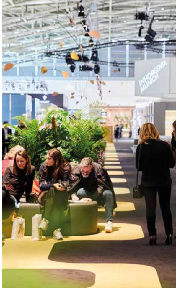
INHORGENTA MÜNCHEN 2020 | INHORGENTA MUNICH 2020

Les développements liés à la pandémie du COVID-19 n'ont pas pris le cours espéré en 2021. La direction du salon Inhorgenta a donc décidé d'annuler l'événement. Pour 2022, le salon, qui se tiendra dans le respect de mesures sanitaires élaborées, doit être le signal de départ du retour à une nouvelle normalité pour le secteur de la bijouterie, de l'horlogerie et des pierres précieuses. Du 11 au 14 février 2022, on devrait à nouveau pouvoir découvrir des collections de bijoux fascinantes et des bijoux au design inspirant. Nous prévoyons également de participer à nouveau en tant qu'exposant avec un stand linéaire et nous nous réjouissons à la perspective de conversations intéressantes, de nouveaux contacts et de vous revoir!